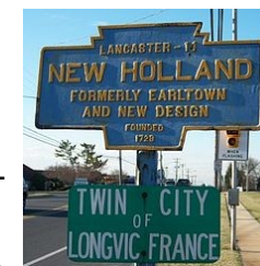
Panneau d'entrée de Ville à New-Holland